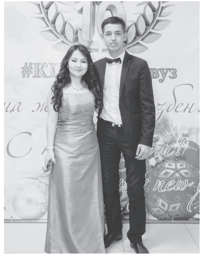
1-орынды иеленгенін және республикалық «Жас ғалым» ғылыми байқауының жеңімпазы атанғанын тілге тиек етуге болады. Мақсат қоя білген жан жетістікке жетеді. Талантты қыздың қазіргі уақыттағы басты мақсаты – ата-анасының үмітін ақтап оқуын үздік аяқтау, оқып жатқан мамандығының