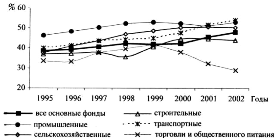
Рисунок 1 - Степень износа фондов организаций по отраслям экономики (на начало года).

Данные по отраслям экономики приведены на рис. 1