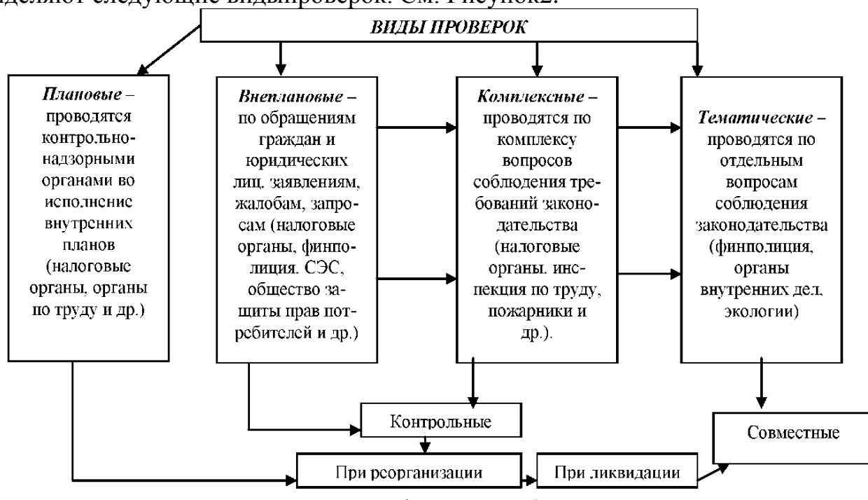
Рисунок 2 – Виды проверок

В соответствии с Законом «О частном предпринимательстве» (ст. 37-1) выделяют следующие виды проверок. См. Рисунок 2.