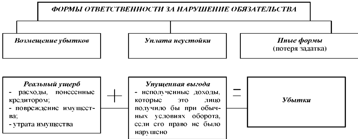
Рисунок 1 – Виды и формы ответственности

Основными формами ответственности за нарушение обязательства являются: возмещение убытков, уплата неустойки, потеря задатка или иные