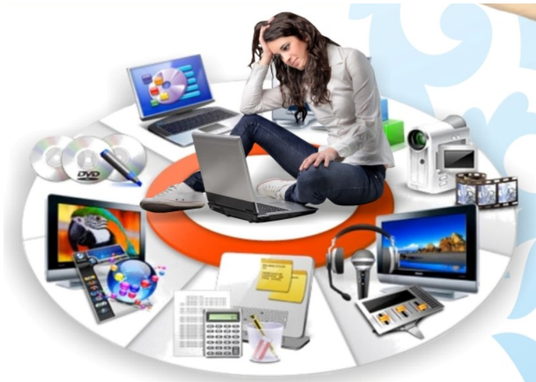
1.1 ?????????????????? ?????????? ??????????

1.1 ?????????????? ?????????????? ?????????? ?????????? ? ?????????????? ?????????????????? ????????????????????? ??????????????